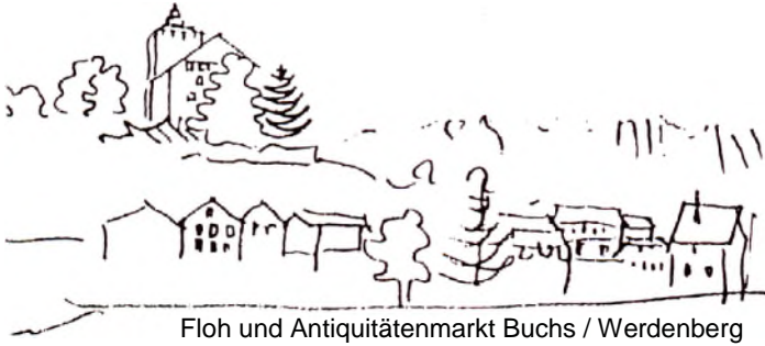
Floh und Antiquitätenmarkt Buchs / Werdenberg