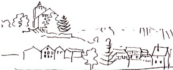
Floh und Antiquitätenmarkt Buchs / Werdenberg